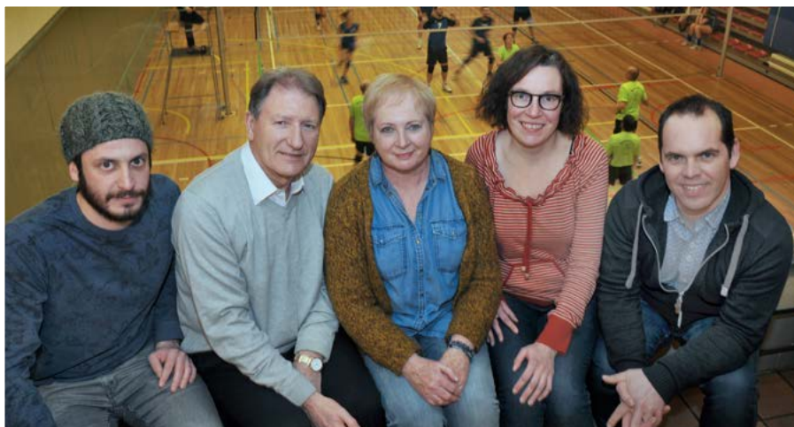
Foto: vlnr: Steve Van Garsse, Lucien Van Cauteren, Hilde Vermorgen, Joke Van Der Borght, Filip Meyten.

om in te wonen en te vertoeven. Zij bedenken positieve projecten zoals het lanceren van Hoplr, het succesvolle buurtvuur en de zaadbommenactie. Ook lopende projecten van de stad volgen zij op, zoals o.a. de herbestemming van de Don Bosco-kerk. Als wijkbewoner weten zij ook wat er leeft in de wijk.